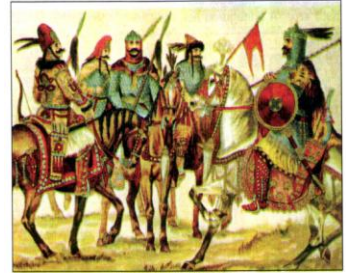
Honfoglalás kori harcosok

Falunk valószínűleg a fent említett családról kapta az Ernye nevet. A Nagy előnévre pedig azért volt szükség, mert a koronkai völgyben létezett hajdan egy Kisernye nevű település. Az eddig fellelt első okirat mely Nagyernye nevét említi, a pápai dézsmák jegyzéke, mely szerint 1332- ben falunknak János nevű papja 14 dénárt fizetett a tizedbe. Tehát már ebben az időben Nagyernyének önálló egyházközsége volt.