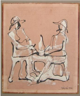
Gáspár Gyula rajza

te elhagyott, te bús, kopár sziget, magyar sziget a népek Óceánján!