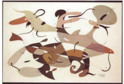
Gáspár Gyula rajza