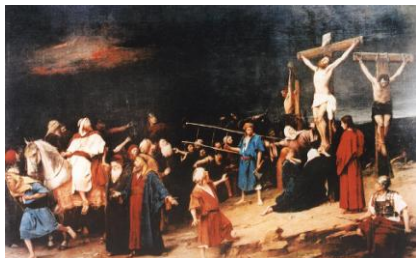
Munkácsy Mihály: Golgota

I. Én még kicsi vagyok, Verset nem tudok. Majd jönnek a nagyok, Mondanak azok. Ajtó mellett állok, Piros tojást várok. Ha nem adják párjával, Elszökök a lányával.