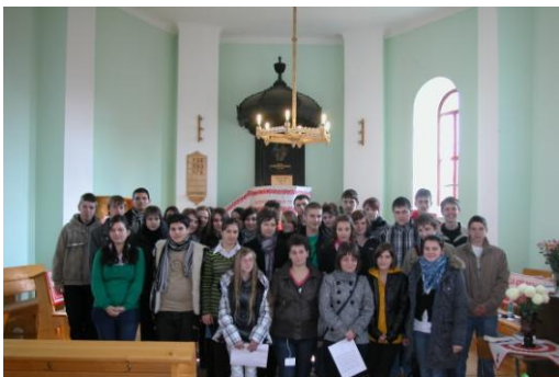
A „Bűvös négyes” tagjai az ernyei református templomban.

Ennek fényében kívánunk Istentől megáldott, békés karácsonyt és boldog új évet minden kedves gyülekezeti tagnak.